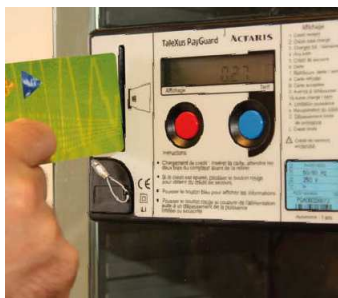
Budgetmeter voor elektriciteit

Als u in uw oude woning zelf geen budgetmeter had, moet u zo snel mogelijk aan uw netbeheerder melden dat er een budgetmeter in uw nieuwe woning is. Uw netbeheerder zal de budgetmeter deactiveren zodat die terug werkt als een gewone meter.