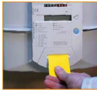
Budgetmeter voor aardgas