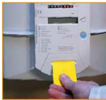
Compteur à budget gaz